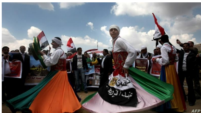
سماع‌کنندگان صوفی در ۲۵ مارس ۲۰۱۱ در میدان تحریر قاهره مراسم اجرا می‌کنند.

حدود ۷۷ طریقت در مصر وجود دارد که همگی از شش طریقت اصلی آن «دسوقیه، شاذلیه، رفاعیه، بدویه، عزمیه و قادریه» سرچشمه می‌گیرند و این طریقت‌ها از طریق سه نهاد سازماندهی می‌شوند: «شورای عالی طریقت‌های صوفیه، اتحادیه عمومی گردهمایی آل‌الیت، نقابت اشراف». ۱